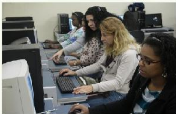
Professores participam de oficina do Projeto Local, Digital, Global

O evento integra o projeto de extensão Local, Digital, Global – mergulho na cultura digital , financiado pelo Ministério das Comunicações. A iniciativa prevê oficinas de curta duração sobre cultura digital para professores de educação básica da rede pública de ensino de Mariana, em seis distritos: Bandeirantes, Cachoeira do Brumado, Furquim, Águas Claras, Passagem de Mariana e Santa Rita Durão.