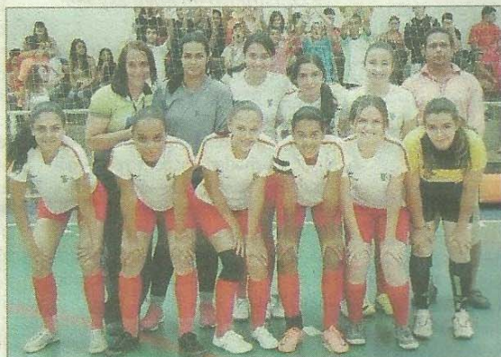
Equipe feminina de futsal