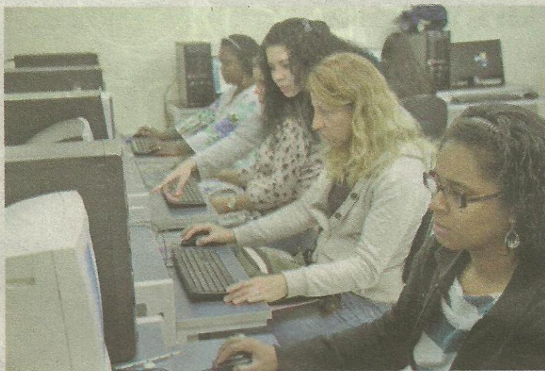
Professores participam de oficina do Projeto Local, Digital, Global

De 26 a 28 de setembro, Mariana e Ouro Preto receberão o I Encontro Local, Digital, Global: letramentos dentro e fora da escola. Promovido pelo Instituto Federal Minas Gerais – Campus Ouro Preto, o evento propiciará discussões sobre possibilidades pedagógicas mediadas pelas tecnologias digitais, para, dessa forma, buscar alternativas de ensino e de aprendizagem.