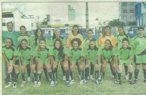
Equipe feminina de futebol

titutos Federais do Estado de Minas Gerais (JIFEM). O encontro foi realizado no IFMG-Campus São João Evangelista em maio deste ano e contou, ainda, com a participação dos campi Bambuí, Congonhas e Governador Valadares.