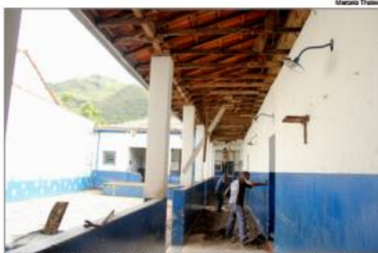
Na Escola Municipal Alfredo Baeta, união de direção e pais permitiu a reforma do telhado, forro da cantina e corredor da escola

A comunidade também tem se mobilizando para auxiliar na limpeza das escolas. Na Escola Municipal Alfredo Baeta, direção e pais se uniram e, por meio de doações e organização de rifas, arrecadaram recursos para fazer a manutenção do telhado e troca do forro da cantina e corredor da escola.